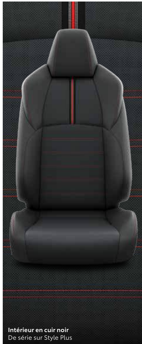
Intérieur en cuir noir De série sur Style Plus