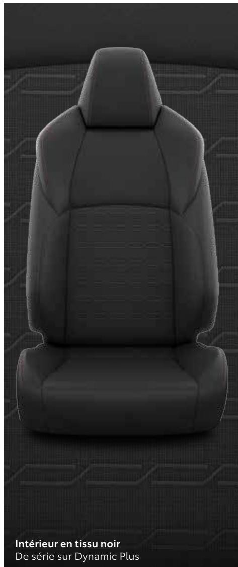
Intérieur en tissu noir De série sur Dynamic Plus