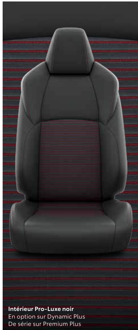
Intérieur Pro-Luxe noir En option sur Dynamic Plus De série sur Premium Plus